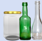
Botellas y frascos de vidrio