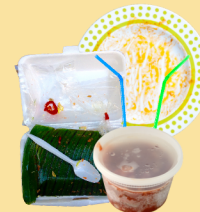
Utensilios de plástico, pajitas, recipientes sucios para llevar