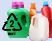
Plástico #2 & #3