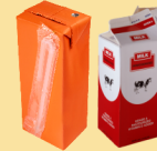
Cajas de jugo y cartones de leche

Todos los demás artículos se pueden colocar en el carrito de vertedero