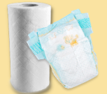
Pañales, toallas de papel usadas