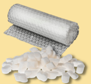
Espuma de poliestireno, película de plástico, bolsas de plástico