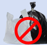
Sin bolsas de plástico, Coloque los materiales reciclables directamente en su carrito