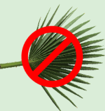
No hojas de palma