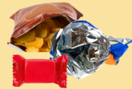
Bolsas y envoltorios